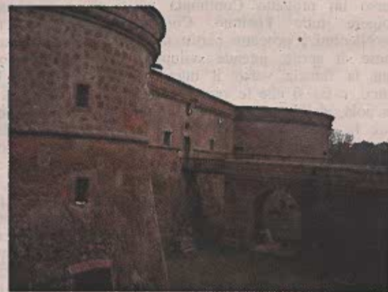
La Rocca Santacroce, 1538

Percorsi educativi e didattici per la conoscenza e la tutela del patrimonio artistico, culturale e naturale del territorio in cui si vive.