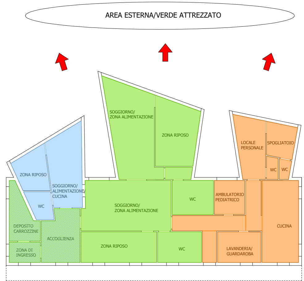
TABELLE DI RIEPILOGO DIMENSIONALE (Superfici utili in mq)